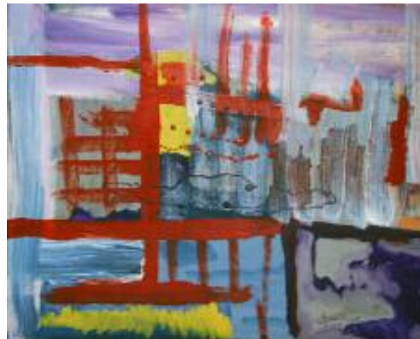
"En la ciudad" (60 x 73 cm)

Optimismo, esperanza y ganas de vivir se mezclan en sus lienzos con la desesperación de la dura realidad.