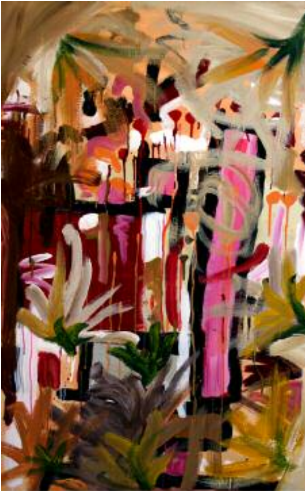
"El jardín del caos" (65 x 100 cm)