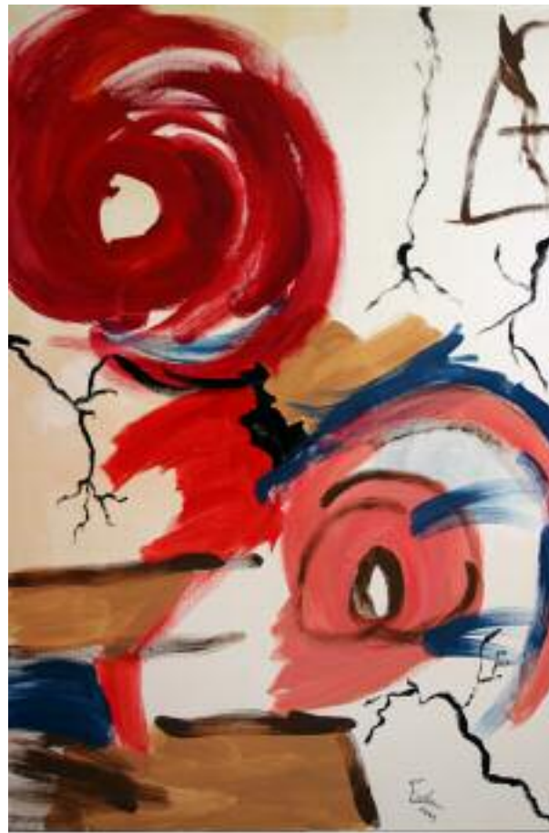
(116 x 81 cm)