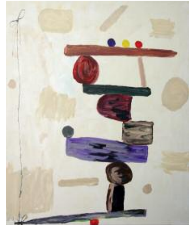
"Fragil" (81 x 100 cm)

Emilio Ferreres intenta mostrar a la sociedad que pese a una grave discapacidad se pueden seguir buscando pequeñas cosas del día a día para seguir hacia adelante.