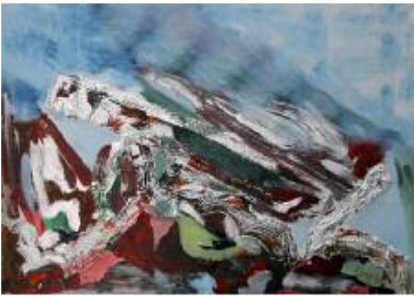
"La tempestad" (85 x 92 cm)