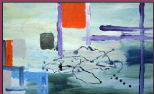
(30 x 60 cm)